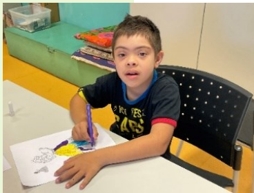
L'éducation : un droit pour tous

Faciliter l'accès à l'autodétermination, tendre à un maximum d'inclusion.