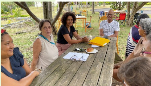
Atelier lors de la journée familiale du 1er avril, 2023