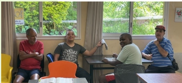
Temps de repos au foyer de vie

Les loisirs doivent être envisagés comme un plaisir, un enrichissement et un bienfait pour la santé. Ils sont un moyen de s'ouvrir aux autres et d'acquérir de nouvelles compétences sociales.