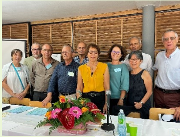
Membres du conseil d'administration, 2023