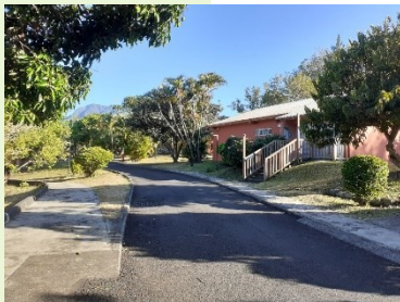
IMPro Trois Mares site Dassy, Le Tampon