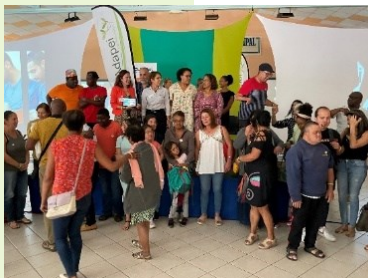
Rencontre avec les familles, journée Auticiel, 2022