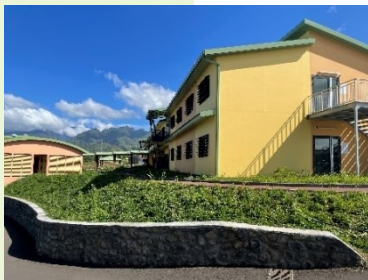
Foyer de vie Arc en ciel inauguré en 2023, Le Tampon