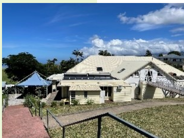
ESAT de Bérive (ancien CAT)