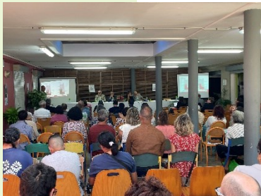
Assemblée générale 2023