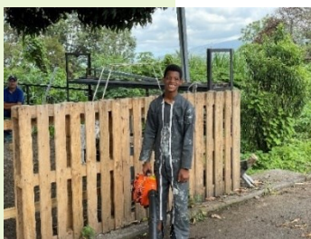
Jeune en formation pré professionnelle à l'IMPro

Quelle que soit la structure (ESAT, entreprise adaptée, entreprise du milieu ordinaire) dans laquelle s'exercera l'activité de la personne, celle-ci nécessitera toujours, à des degrés variables, un accompagnement social et professionnel. Une structure adaptée permettra de suivre le projet de vie de la personne handicapée au travail et par là même, favorisera sa promotion sociale.