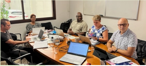
L'équipe de direction de l'Adapei La Réunion