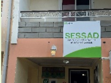
SESSAD, Le Tampon