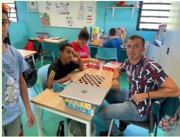
Salle de classe à l'IMP

d'accéder à un travail, un métier, qui, à l'âge adulte, sera pratiqué en milieu protégé, voire en milieu ordinaire pour certains.