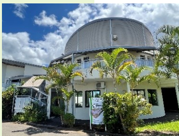
IMP Bel Air, Le Tampon