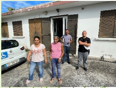
Les résidents de la villa la Roseraie